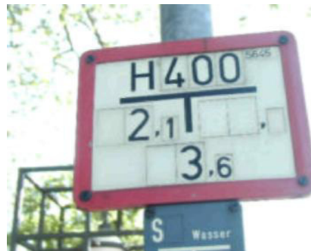
Hinweisschild eines Unterflurhydranten

Nutzen Sie keinesfalls gekennzeichnete Feuerwehrstellflächen und –zufahrten. Das Gleiche gilt für Einrichtungen wie Löschwassereinspeisungen, Überflurhydranten oder auch Notausgänge von Gebäuden.