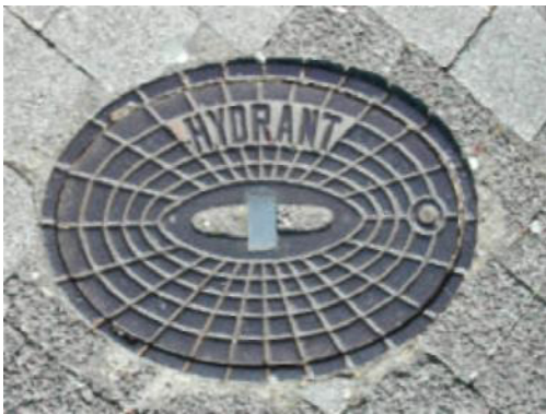
Abdeckung eines Unterflurhydranten

Beim Aufbau sollten Sie darauf achten, das keine Löschwasserentnahmestellen blockiert werden. Gerade Unterflurhydranten, die man an der typischen ovalen Form der Schachtdeckel erkennt und die die wichtigste Grundlage für die Wasserversorgung bei der Brandbekämpfung stellen, werden oft ohne böse Absicht durch Stände, Wagen o.ä. zugestellt. Halten Sie auch die vorhandenen Hinweisschilder frei, um ein schnelles Auffinden der Hydranten zu ermöglichen.