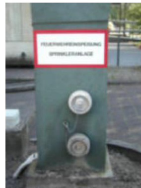
Einspeisung für eine Sprinkleranlage