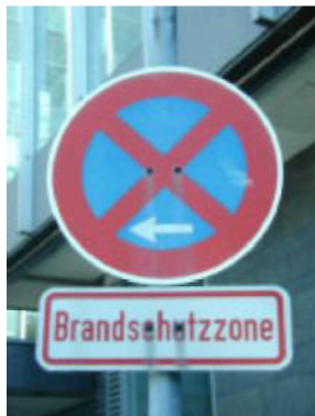
Hinweis auf eine Brandschutzzone

Nutzen Sie keinesfalls gekennzeichnete Feuerwehrstellflächen und –zufahrten. Das Gleiche gilt für Einrichtungen wie Löschwassereinspeisungen, Überflurhydranten oder auch Notausgänge von Gebäuden.